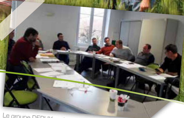
Le groupe DEPHY en formation Synergie