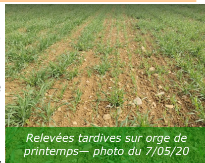
Relevées tardives sur orge de printemps— photo du 7/05/20

➤ Désherbage : Les parcelles étaient très propres jusqu'au retour des pluies. Dans les zones à levées hétérogènes, des renouées ont pu lever dernièrement. Les dernières interventions en végétation ont eu lieu au cours de la semaine dernière. Les céréales arrivant à montaison et les pois mettant en place leurs vrilles, les interventions mécaniques sont maintenant déconseillées. ➤ Maladies : Rien à signaler.